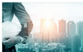
Safety and Security