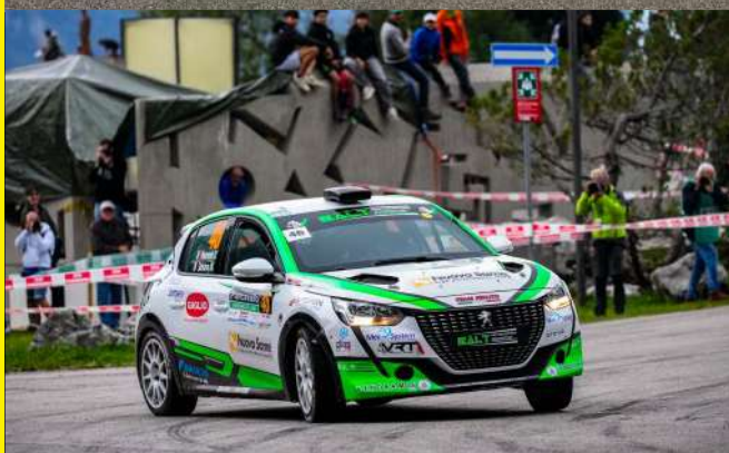
DISPONIBILE SIA CON ASSETTO DA ASFALTO CHE DA TERRA